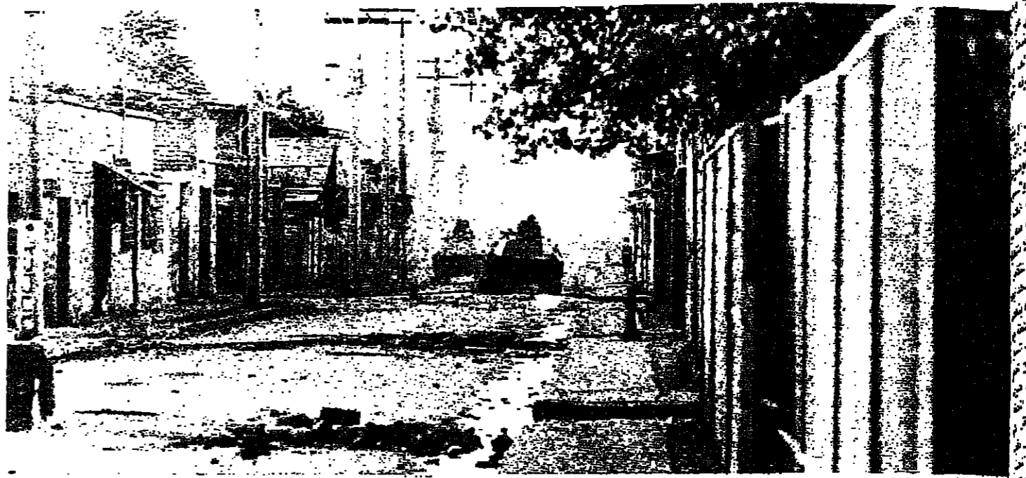
البيات الشرطة تفسد الشوارع في شاحنة سنتياغو الفقيرة